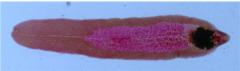
شکل ۲- بالغ فاسیولا ژیگانیتیکا

این ترماتود از نظر مورفولوژی به فاسیولا هپاتیکا شباهت دارد، ولی شانه‌ها کمتر تکامل یافته، مخروط رأسی کوتاه تر و انگل بسیار طویل تر و کمی باریک تر است. متوسط نسبت طول به عرض انگل در فاسیولا ژیگانیتیکا بیش از دو برابر فاسیولا هپاتیکا می‌باشد. طول این انگل ممکن است به حدود ۷ سانتی‌متر (۲۴-۷۶ میلی‌متر) و عرض آن به ۵-۱۳ میلی‌متر برسد. فاصله آخرین بیضه از انتهای بدن در فاسیولا ژیگانیتیکا بسیار طویل تر از فاصله مشابه در فاسیولا هپاتیکا است (۱۰).